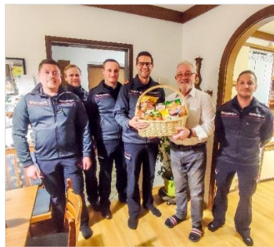
Seinen 70er feierte BM Helmut Mitterlehner am 29.11.