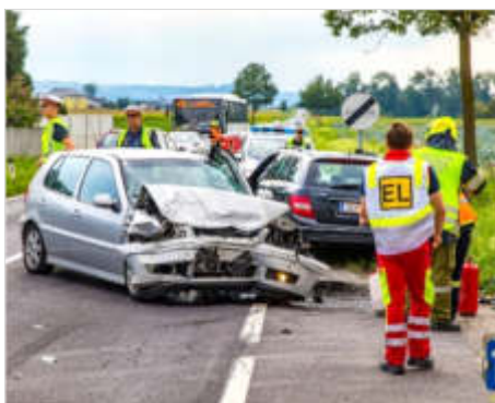
Fotos unten: Frontalzusammenstoß auf der B-129 (Einfahrt Feldstraße) am 22.08.