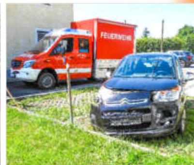
Fotos oben: Verkehrsunfall mit eingeklemmter Person auf der B-129 in Strass am 24.07.