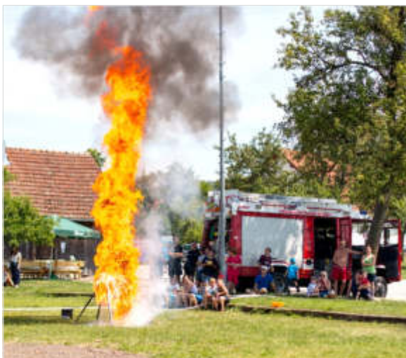
Fotos unten: Tag der offenen Tür am 20.07. im Rahmen des Ferienprogramms der Gemeinde Alkoven.