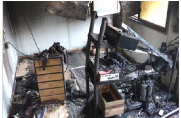
Fotos oben 1: Brand eines Abfallcontainers am 15.05. Fotos oben 2: Brand eines Wohncontainers am 31.08. Fotos unten: Brand in der Werkstatt eines Wohngebäudes am 17.11.