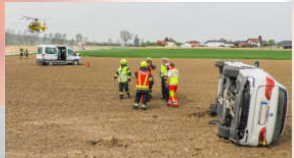
Fotos unten: Verkehrsunfall nach Zusammenstoß zweier PKWs auf der Weidacher Kreuzung am 23.04.