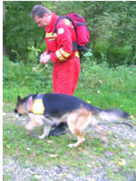
Alarmstufe II – Übung mit Hundestaffel