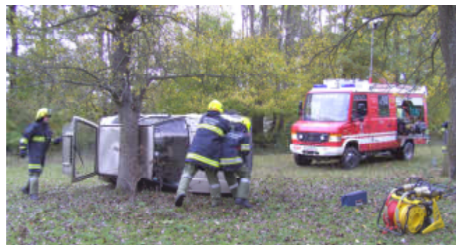
Oben: Übung vom 20.10. - Schnelles und sicheres retten einer Person aus dem verunglückten Kraftfahrzeug.